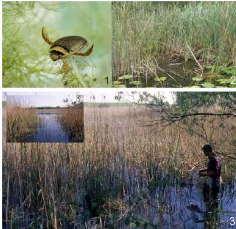
Ambiente di vita della specie (da Hendrich et al., 2012).

Non si hanno notizie certe sul suo ciclo vitale, probabilmente è specie monovoltina, che si riproduce una sola volta nel corso dell'anno, con periodo riproduttivo esteso a tutta la primavera e con svernamento allo stadio adulto. L'accoppiamento avviene in acqua, le uova sono deposte tra la tarda primavera e l'inizio dell'estate, lo sviluppo di uovo, larva e pupa richiede complessivamente circa sessanta giorni, e gli adulti probabilmente svernano nell'acqua e si rinvergono durante tutti i mesi dell'anno (Franciscolo 1979; Nilsson & Holmen 1995). Come in tutti i Dytiscidae, la ninfosi si verifica a terra, all'interno di cellette sotterranee sulle rive di stagni e laghi.