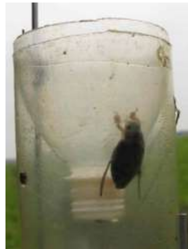
Schema con bottiglia trappola installata a sx e bottiglia trappola rovesciata con dentro un esemplare di Dytiscus sp. a dx (da Cuppen & Koese, 2005).