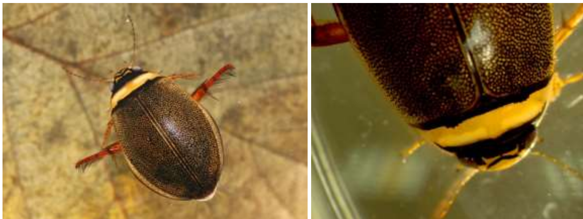
Immagini di adulto di Graphoderus bilineatus ; a dx con particolare del torace.